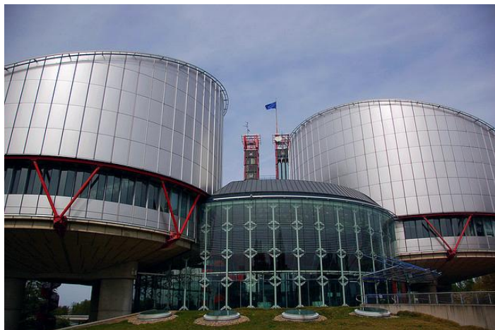
Evropský soud pro lidská práva