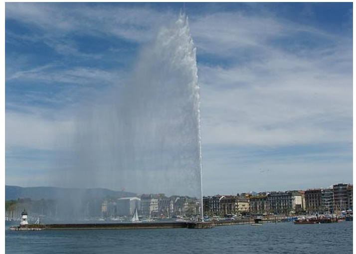
Ženeva – město v zátocě stejnojmenného jezera

Ženeva, město s krásnou polohou na břehu jezera, které se v originále nazývá Lac Léman, je nejen metropolí francouzsky mluvící části Švýcarska a městem s reformační (kalvínskou) tradicí, ale dnes především mezinárodním centrem.