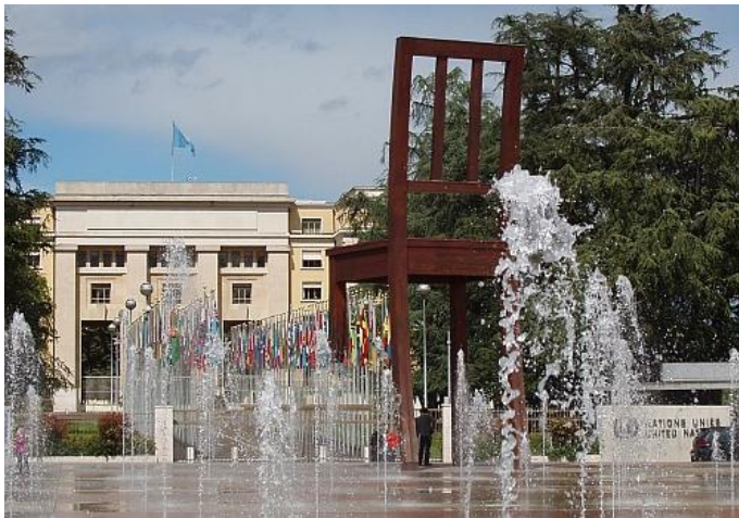
Ženeva – Palác národů

V Ženevě sídlí také Vysoký komisař OSN pro lidská práva (UNHCHR) a část Sekretariátu OSN, která zabezpečuje agendu lidských práv. Sídlem UNHCHR je Palais Wilson , což kdysi bylo původní sídlo Společnosti národů (před vybudováním Paláce národů).