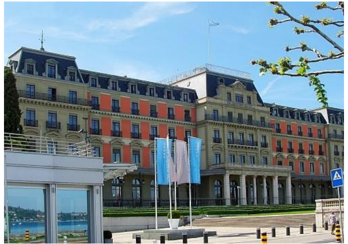
Ženeva – Palais Wilson

Česká republika byla v květnu 2011 zvolena na tři roky do Rady pro lidská práva.