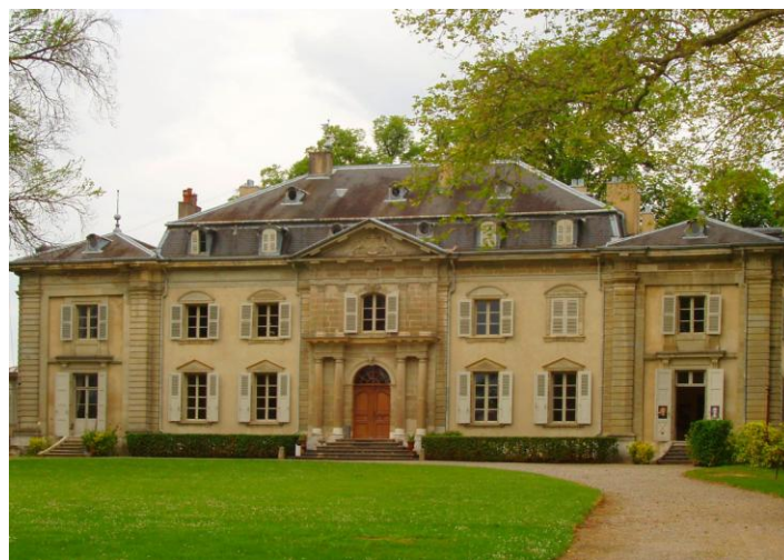
Zámek Château de Voltaire

Napsal zde řadu děl a hlavně se na tomto zámku setkával s intelektuálními osobnostmi tehdejší Evropy.